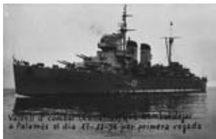
Vaixell Canariats , s.d.