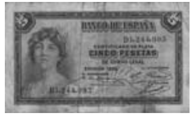
Bitllet de cinc pessetes emès el 1935.

L'últim salari del qual hi ha constància que cobra és la mensualitat del mes d'octubre, 310 pessetes que cobra el 13 de novembre.