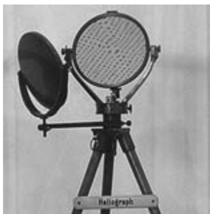
Heliògraf de l'època.

Explica que els arriben heliògrafs (un aparell utilitzat principalment durant el segle XIX per a comunicar-se de forma instantània entre dos punts allunyats entre si) amb els quals fan pràctiques diàriament. El seu funcionament és molt senzill, l'operador tapa o destapa el mirall, situat cara al sol, i utilitza l'auxiliar per a orientar la llum cap al receptor. Transmetien els missatges amb el codi morse, i el senyal recorria distàncies de més de 50 quilòmetres. Les feines dels de transmissions consistien en la recepció i emissió de missatges i la de instal·lar i/o reparar les línies de comunicació abans, mentre i durant la batalla.