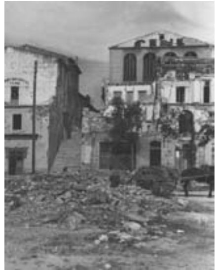
Efectes dels bombardejos a l'antic Hotel Trias, [1939-1940].

La seva preocupació per aquest bombardeig queda reflectida a la carta del 15 de setembre "Estimadíssims pares, avia, germana i demés familia; Ahir vaig rebre la vostra del dia 9