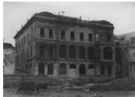
Efectes dels bombardejos a la Casa Ribera, [1939-1940].