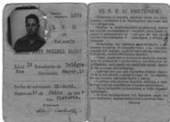
Carnet de telegrafista de Lluís Colléll, 1939. Fons Colléll Grassot

Acabat el servei militar imposat pel nou règim, el 1942 ja alliberat de l'exèrcit, s'embarca a la marina civil com a oficial radiotelegrafista per poder realitzar el seu somni... els vaixells i la mar.