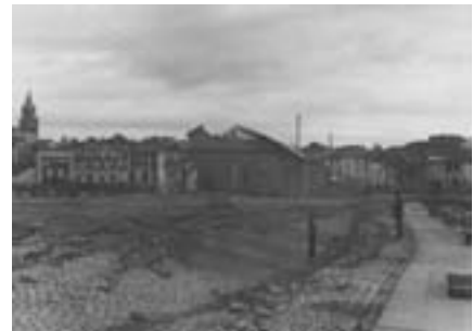
Efectes dels bombardejos al moll de Palamós, [1939-1940].