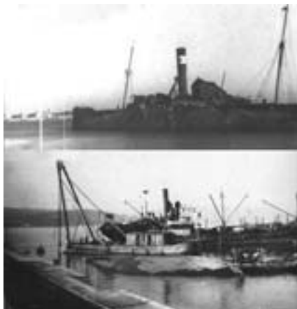
Vaixell Lake Lugano a la badia de Palamós, s.d.