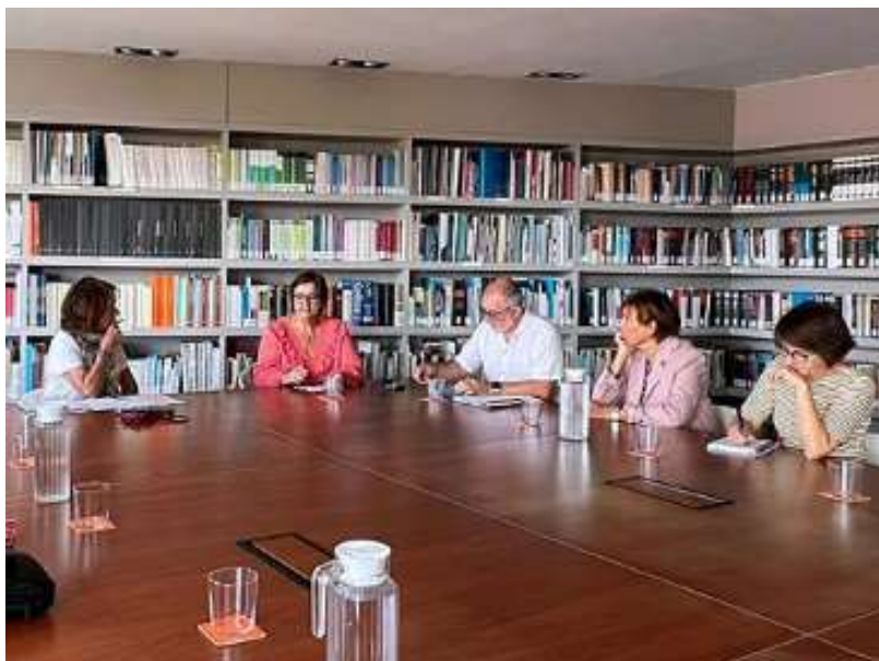
Sessió d'estudi de possibles col·laboracions entre les entitats

28.09.2022 Reunió de la Junta directa del Fòrum amb a la Síndica de Greuges de Catalunya