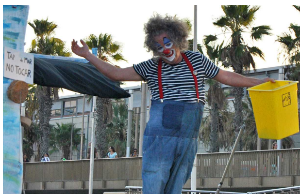
Pescaplàstik és una activitat de sensibilització envers l'entorn marí dirigida a tota la família