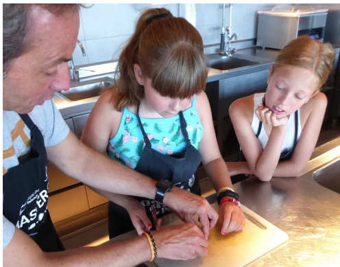
L'Espai del Peix ofereix l'activitat Petits Xefs des de l'any 2011

Aquest estiu hi ha hagut força novetats a l'Espai del Peix. La primera, un nou format de l'activitat Petits Xefs, que enguany ha tingut lloc de dimarts a dijous, de 10.15 a 12.15 h dirigida a nens i nenes de 7 a 14 anys. Cada dia han cuinat dos plats amb peix enfocats als seus gustos. Els divendres, en el mateix horari hem ofert l'activitat Joves Xefs, pensada per a joves a partir de 15 anys. Els plats d'aquesta activitat han estat de cuina d'actualitat i sempre elaborats amb peix de Palamós, i de tant en tant, algun plat dolç. Els dimarts a la tarda, s'ha dut a terme la Visita de la Gamba de Palamós, amb un petit tast