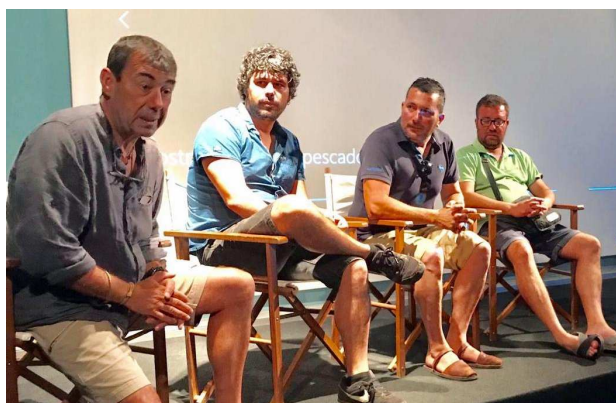
El cicle de cinema documental Mar fràgil forma part del programa de la Mostra Internacional de Cinema Etnogràfic que organitza la Generalitat de Catalunya

pesca a la costa catalana, tant amb grans maquetes de xarxes i barques com amb ulleres de realitat virtual, les talles mínimes legals que han de tenir els peixos per al seu consum, la fragilitat de certes espècies marines com la posidònia o les gorgònies, la recollida de residus i el seu tractament... En definitiva, transmetre als més joves que el mar és un lloc extraordinari, que s'ha d'estimar i respectar i no convertir-lo en un gran abocador.