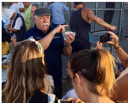
La Confraria de Pescadors de Palamós ha col·laborat en la realització de la visita guiada a la subhasta del Peix Blau

Amb el desig que els nostres visitants s'hagin endut una bona experiència, des del Museu ja preparem la programació de tardor i d'hivern. Ho fem amb les forces renovades i el mateix objectiu: posar a l'abast de tothom el patrimoni cultural i marítim de Palamós.