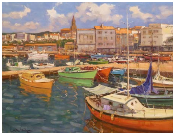
Des del club nàutic. Oli sobre tela

Costa Sobrepera ha estat el guanyador de la convocatòria 2014 d'exposicions artístiques temporals del Museu de la Pesca. La mostra estarà oberta al públic del 12 de desembre de 2014 fins a l'1 de febrer de 2015. L'entrada és lliure i els horaris són els d'obertura del Museu de la Pesca.