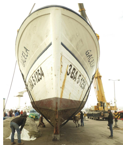
Durant unes deu setmanes s'han pogut seguir les tasques de manteniment de la Gacela al moll de Palamós.

Tot plegat amb la col·laboració de Ports de la Generalitat, la Confraria de Pescadors de Palamós i l'empresa General Nàutic.