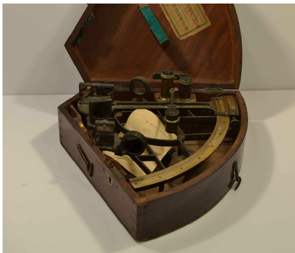
Sextant Hughes, Londres, de la col·lecció del Museu Darder de Banyoles.