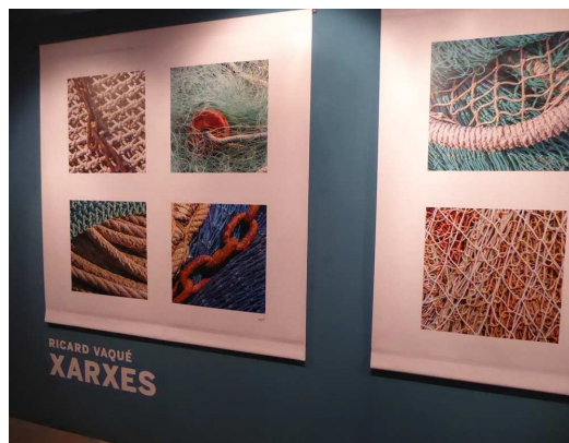
Una cinquantena d'imatges formen la mostra "Xarxes".

L'autor fa una composició amb les seves imatges que permetran al visitant descobrir petites obres d'art accidental, si ens hi sabem acostar sense pressa.