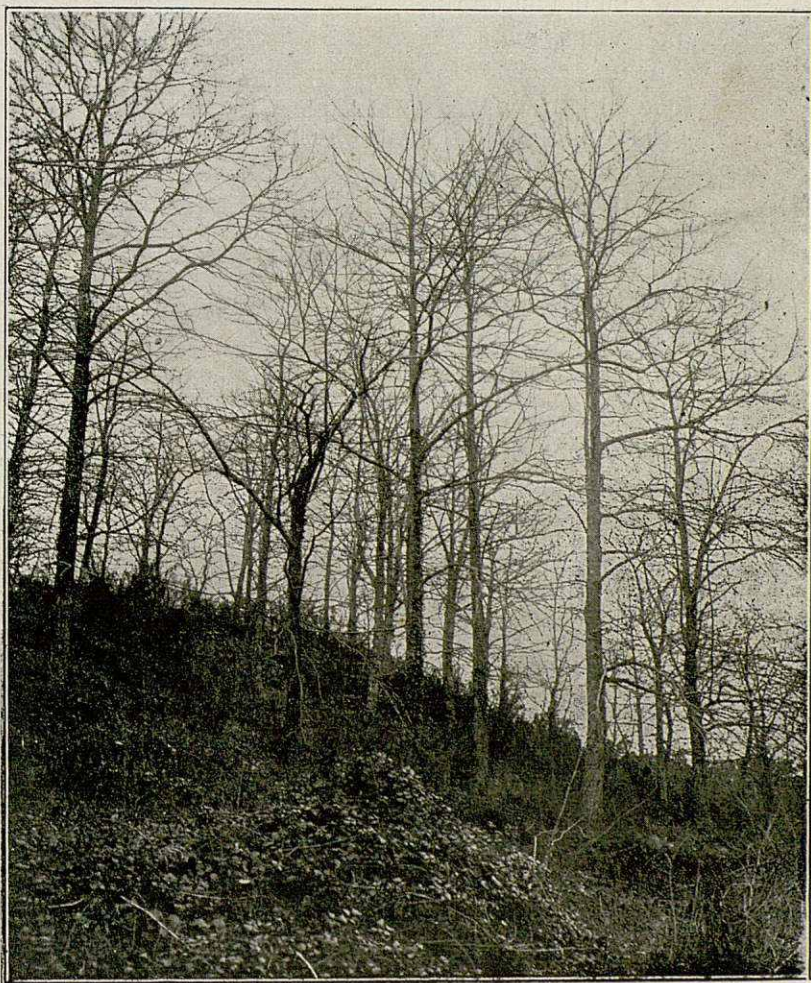
CASTANYERS DE FITÓ