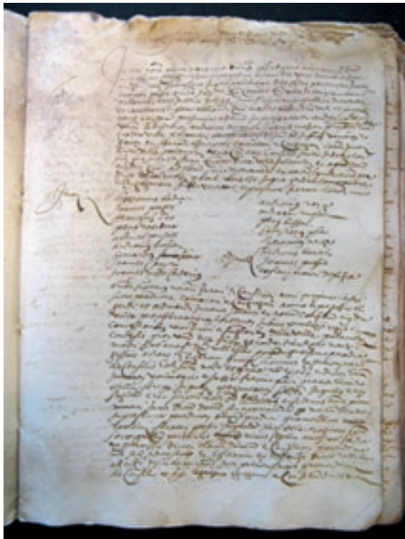
Elecció dels jurats i els consellers, 1568

Les escriptures que formen aquests tres grans grups apareixen intercalades al Manual, on, amb poques excepcions, es van anar copiant en l'ordre cronològic en què s'anaven signant. Com és característic de la documentació notarial, les actes de cada grup presenten una estructura i una formulació pràcticament idèntiques i només varien les disposicions particulars de cadascuna. I, com és habitual també entre els documents notarians catalans de fins a la segona meitat del segle XVIII, estan redactades en llatí en la seva gran majoria.