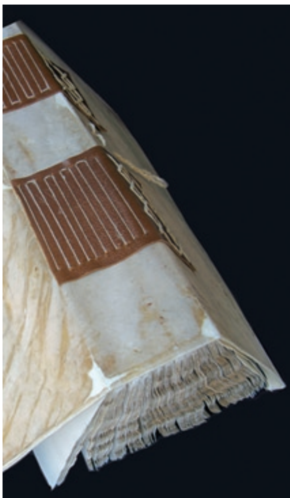
El còdex després de la seva restauració

El Manual del Comú, o de la universitat de Palamós, és un llibre d'un valor singular: es tracta del manuscrit o còdex en què es van anar recopiant les actes que escripturaven algunes de les actuacions més importants que van portar a terme els òrgans de govern de la vila durant el període 1565-1574. Amb aquesta cronologia tan reculada, és el recull més antic d'aquestes característiques que conserva el Servei d'Arxiu Municipal de Palamós, encara que no el més antic de què es tenen notícies, ja que consta l'existència a l'Arxiu Històric de Girona de dos manuals més d'actes d'aquesta universitat de les etapes compreses entre els anys 1517 i 1555 d'una banda, i 1554 i 1557, de l'altra.