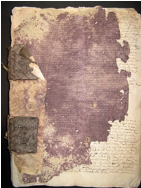
Estat del Manual abans de la seva restauració