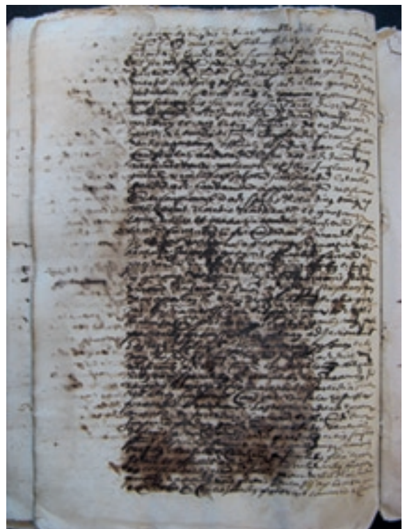
La corrosió de les tintes causà un deteriorament important del còdex

Després de l'aigua, la corrosió de les tintes que es van emprar per a anotar-hi les actes ha estat l'agent que més ha degradat el manuscrit. Durant el segle XVI va ser molt habitual l'ús de les anomenades tintes metal·logàliques en l'escriptura dels documents de caràcter jurídic com els que es recullen al Manual. A causa dels components àcids que intervenen en la seva elaboració, aquestes tintes són inestables químicament: s'alteren en combinació amb la humitat ambiental i perforen els suports de paper sobre els quals s'han utilitzat. En els seus estadis més avançats, l'alteració de la tinta provoca la desintegració completa i irreversible de tota la caixa d'escriptura del document, l'àrea ocupada pel seu text, de tal manera que es conserven únicament els marges i les altres zones no escrites dels fulls. Algunes parts del Manual de la