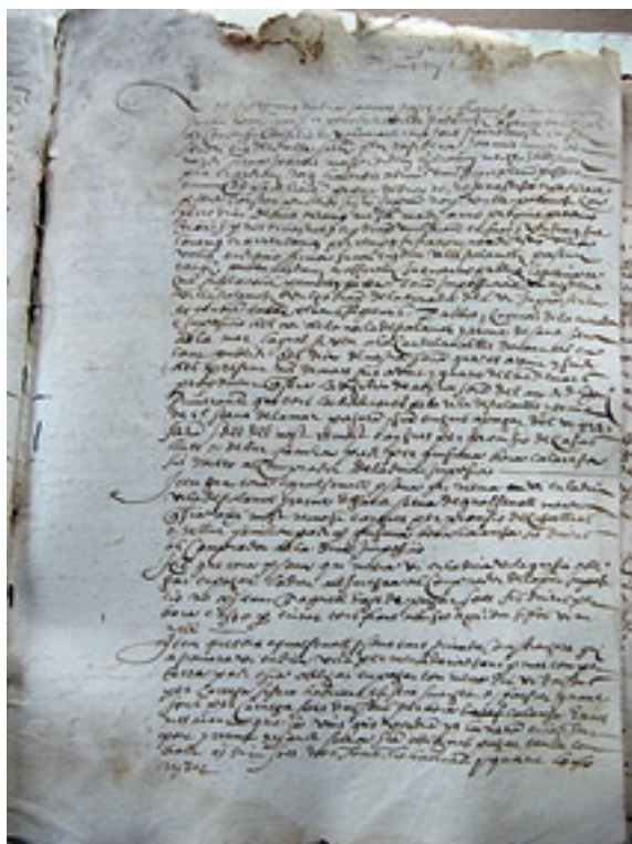
Taba de l'arrendament de la imposició del vi, 1568

1570, la botiga de l'oli, a canvi de pagar a la universitat el preu pel qual havien aconseguit la concessió. El benefici que els corresponia era, per tant, la diferència entre la recaptació que obtenien i el preu que pagaven per l'arrendament.