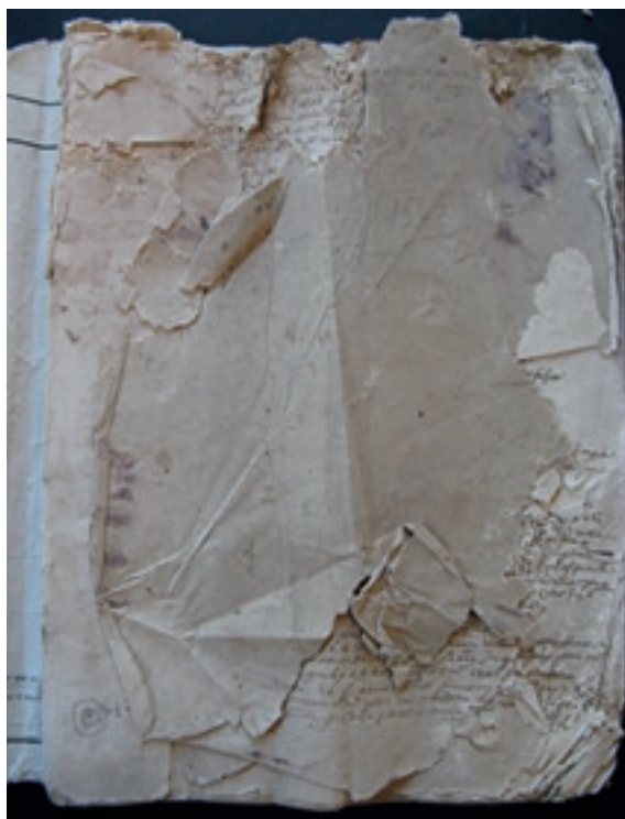
Full de guarda del Manual abans de la seva restauració

Els primers folis del Manual van patir de manera molt acusada els efectes de l'aigua i dels fongs i bacteris que hi van créixer després que es produís la inundació. Aquests efectes s'han traduït en la destrucció d'una part molt important del suport de paper dels fulls i, per tant, en la pèrdua irreparable de l'escriptura que contenien aquestes zones destruïdes. Però l'acció de l'aigua ha estat encara més perjudicial sobre els últims folis del manuscrit: aquest ens ha arribat incomplet per la seva part final, on s'han perdut gairebé totes les escriptures de l'any 1574, l'últim que s'havia inclòs originàriament al volum, com a conseqüència, molt probablement, de la inundació. En altres casos menys greus, i sense arribar a la destrucció completa del suport, l'aigua i els microorganismes van provocar la pèrdua de consistència del paper conservat, que s'havia tornat molt vulnerable a qualsevol manipulació, de tal manera que, si no es consolidava, el risc que s'acabés perdent amb la consulta del manuscrit resultava molt elevat. Per últim, la humitat va alterar també la tinta de l'escriptura, que s'havia decolorat fins a fer-se pràcticament invisible a l'ull humà en els casos d'afectació més extrema, que, afortunadament, són poc freqüents al Manual.