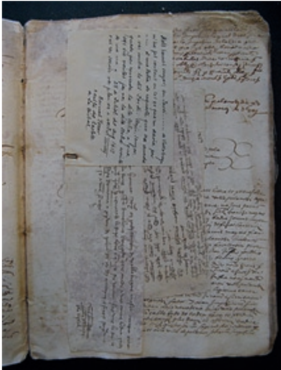
Documents del s. XV localitzats a l'interior del Manual