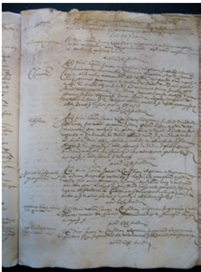
Nomenaments dels càrrecs municipals de Palamós, 1568

Un cop reunides les autoritats cessants a la Casa del Consell, podia començar ja l'elecció dels nous jurats i consellers, que es desenvolupava d'acord amb la reglamentació establerta l'any 1448 per la reina Maria. La mecànica que s'hi seguia combinava l'extracció a la sort segons el ritual de la insaculació i la designació directa dels càrrecs i es troba descrita minuciosament a totes les escriptures: S'elaboraven catorze boles de cera de petites dimensions, anomenades rodolins, i s'introduïa a l'interior de cinc d'aquestes boletes un fragment de pergamí que tenia anotada la paraula " Elector ", que havia de quedar ben ocult per la cera. Els rodolins es posaven en una bossa de roba o en un petit sac (d'on deriva el nom d' insaculació , que significa "introducció en un sac", amb què es coneix aquest cerimonial electoral) i se sacejaven a fi que es barrejessin bé els