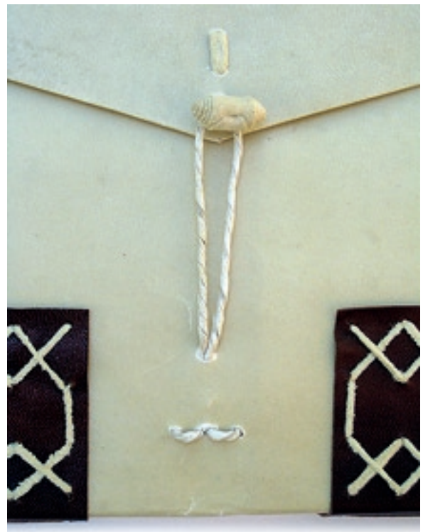
Detall de l'enquadernació "de cartera" del Manual

La humitat ha estat l'agent que ha afectat el Manual de manera més greu al llarg de la seva història. Una part molt important del patrimoni documental català es va conservar en espais molt inadequats i en condicions deficientes fins a la seva instal·lació en els arxius actuals. Com a conseqüència d'aquest fet, molts documents històrics van patir inundacions, degoters i altres desastres semblants en el transcurs dels segles. Aquest ha estat el cas del Manual de la universitat de Palamós de 1565-1574, que es va veure afectat per una inundació produïda en circumstàncies que es desconeixen. L'enquadernació i els quaderns més exteriors del volum van ser, òbviament, les parts més danyades per l'aigua, que sembla haver estat la causa que s'hagi perdut íntegra la seva coberta posterior i gairebé tota l'anterior. Com ja s'ha indicat, les cobertes de pergamí del manuscrit protegien els fulls de paper, més febles, del deteriorament provocat per la humitat i per altres agents externs. Un cop privats d'aquesta protecció, els primers i els últims quaderns del còdex van quedar exposats directament a l'acció de tots aquests agents.