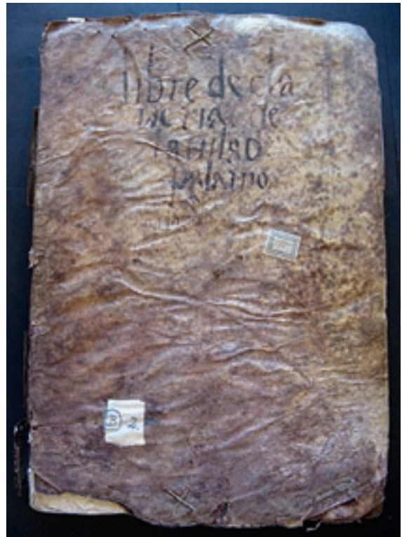
Llibre del clavari, 1562-1581.

A diferència del llibre de la universitat de Palamós de 1517 a 1555 que s'ha esmentat abans, que és una recopilació pràcticament exhaustiva de les actes del comú de la vila, el Manual de la universitat de Palamós de 1565-1574 és un recull selectiu d'escriptures. Els instruments que s'hi apleguen es poden agrupar, en la seva gran majoria, en tres conjunts molt homogenis: el primer està format per les actes d'elecció dels càrrecs municipals de la vila i la parròquia de Palamós; el segon, pels instruments d'arrendament dels seus impostos locals, i l'últim, per les actes de nomenament de representants o síndics, que actuaven en nom dels jurats i el municipi en situacions particulars. El còdex no registra, en canvi, altres escriptures que també es relacionen directament amb l'administració de la població i que es van anotar als manuals de la notaria local o en alguns llibres especials de la seva universitat, com els del clavari, dels quals el Servei d'Arxiu Municipal de Palamós conserva també alguns exemplars.