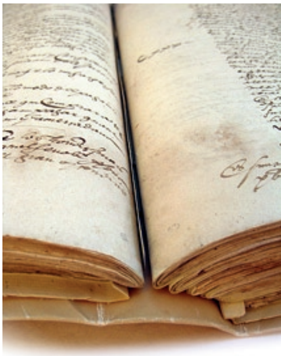
Plecs que componen els quaderns del Manual restaurat

Com la majoria de llibres que es van utilitzar en l'època medieval i moderna per a registrar-hi actes, el Manual de la universitat de Palamós de 1565-1574 és un còdex format per la superposició de diversos quaderns de paper, en concret vuit. Els fulls que componen aquests quaderns s'anomenen tècnicament plecs, bifolis o dobles folis a causa de les seves grans dimensions i s'hi utilitzen plegats pel mig formant dos folis. Tots els quaderns del manuscrit estan constituïts per dotze o tretze bifolis, a excepció d'un petit conjunt de quatre fulls de menor dimensió que es va cosir entre les seves pàgines 116 i 125. El registre conserva actualment 203 fulls escrits o útils, no numerats en origen, i el full de respecte anterior, que també pertany al còdex original i conté el seu títol i alguna anotació posterior més. El paper de tots els folis és del mateix tipus i presenta, per tant, un gruix, una textura i un color homogenis al llarg del volum; l'única filigrana o