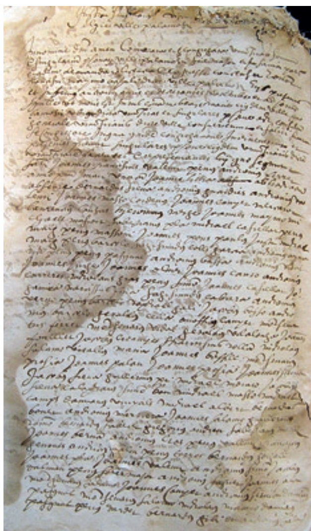
Sindicat de la universitat de Palamós signat el 1573

La venda dels censals no era formalitzada habitualment pels jurats o els consellers de Palamós, sinó que es confiava a uns apoderats o síndics, que la signaven en nom de la universitat. El municipi designava aquests apoderats amb unes actes que formen el tercer i últim grup d'escriptures inscrites al Manual a què s'ha fet referència abans, que es coneixen amb el nom de sindicats. Aquests són pràcticament els únics documents presents al còdex que va atorgar l'assemblea general dels caps de casa de la vila en lloc dels seus representants. Per aquest motiu, s'inicien amb una relació extensa dels veïns que assistien a l'acte de la seva signatura, una enumeració que és una font, si es vol parcial i secundària, però en qualsevol cas valuosa per a l'estudi de la demografia de la localitat, perquè constitueix un indicador aproximat del nombre de focs que hi havia a la vila i la parròquia de Palamós. La signatura dels sindicats, que, com altres negocis del comú, havia de comptar amb l'autorització expressa del batlle del comtat, acostumava a tenir lloc a l'interior de l'església