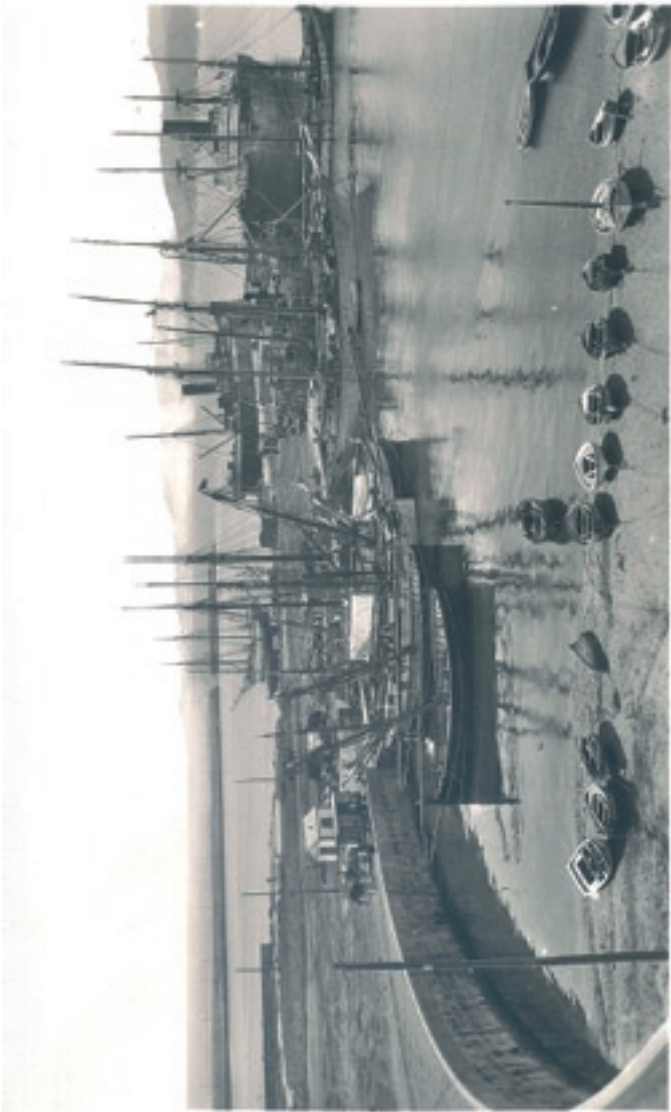
PALAMÓS - 87 (Costa Brava)